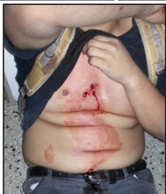
Manifestantes con lesiones causadas por perdigones en distintas áreas del cuerpo durante protestas en el estado Táchira

Aunado a lo anterior, se ha observado el uso de armas de fuego por parte de los llamados colectivos o grupos armados afectos al gobierno, los cuales utilizan sus armas durante